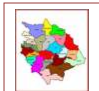
Comuni del Cilento