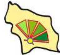
SER.A.F. Servizi Associati dei Comuni del Frusinate