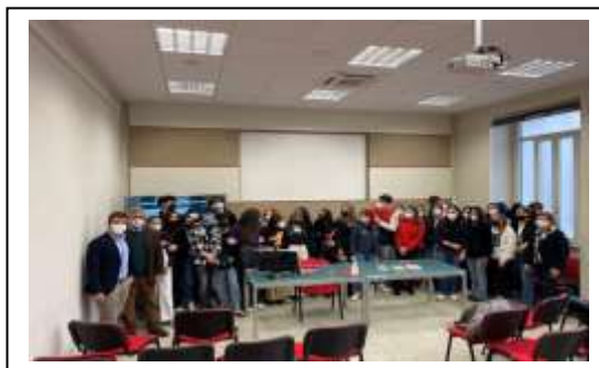
Liceo Artistico e Liceo Classico