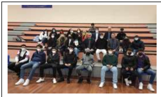
IIS Medaglia D'oro –Cassino 30.03

Nelle cinque realtà i docenti hanno raccolto gli studenti che hanno convenuto di coinvolgere nell'iniziativa.