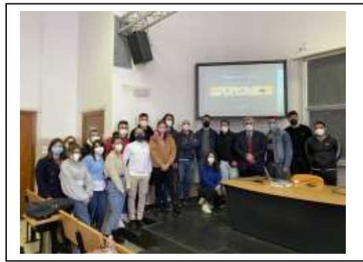
Dip. Ingegneria Gestionale

Nella stessa riunione si è condiviso il senso dell'iniziativa, il programma da seguire, gli appuntamenti previsti e il risultato atteso. Poi si è passato in rassegna il rapporto tra Confino-Guerra-Manifesto-Europa. Per capire il nesso di consequenzialità tra: Stato totalitario-privazione della libertà e della democrazia – guerra-rimedio alle guerre - Unione europea- Manifesto. Infine si è fatto un excursus storico dell'evoluzione della struttura dell'Unione Europea (Unione per evitare la guerra a Unione per condividere politiche comuni di qualità della vita e di libera circolazione delle merci e delle persone).