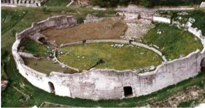
Anfiteatro romano a Cassino