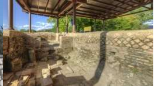
L'antica di Città romana di Aquinum a Castrocielo

Il patrimonio lasciato dalle persone che hanno vissuto sul Territorio da migliaia di anni: dai popoli Italic, ai castelli medievali, passando per i romani, è strumento di riconoscimento identitario, favorisce la cultura storica e alimenta il turismo culturale.