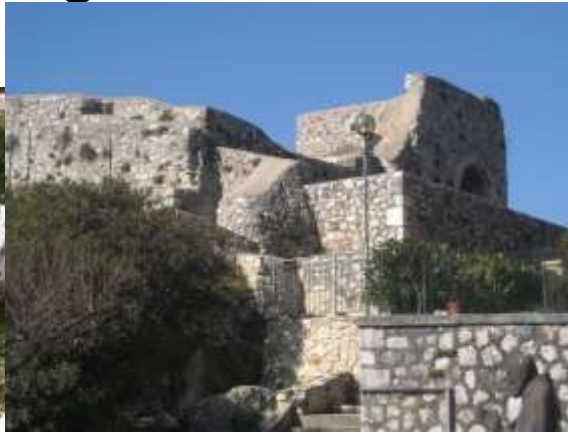
Il Castello medievale dei Conti di Aquino – Piedimonte San Germano