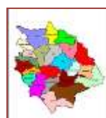
Comuni del Cilento Centrale