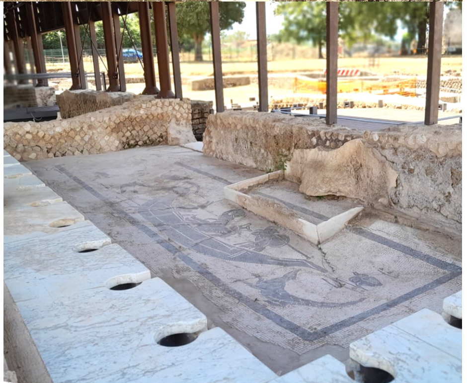
Teatro Terme centrali