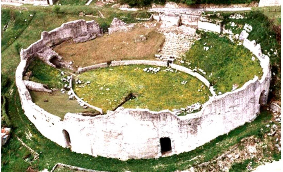
Via Latina Teatro Anfiteatro