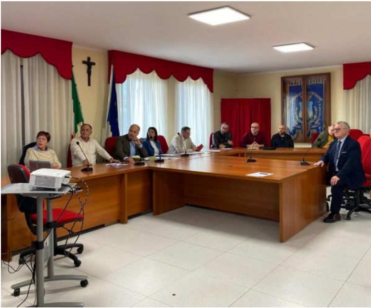
I partecipanti in presenza