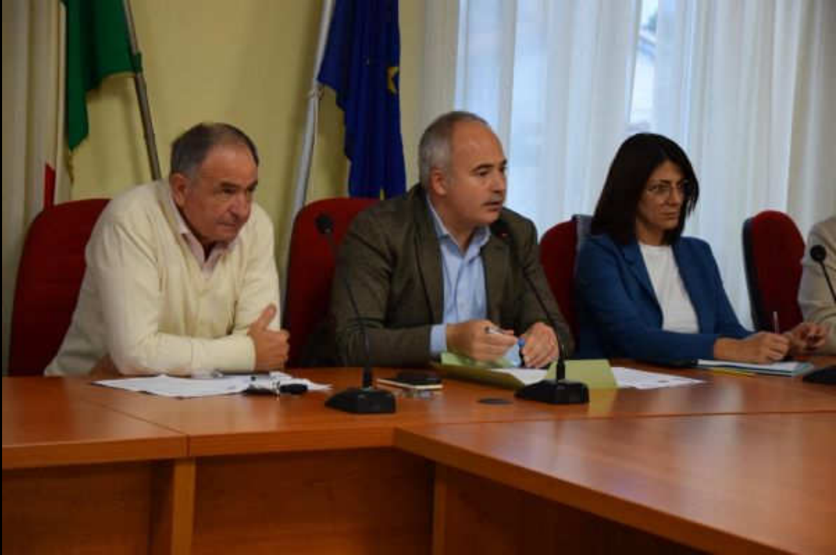
Il Sindaco di Piedimonte San Germano