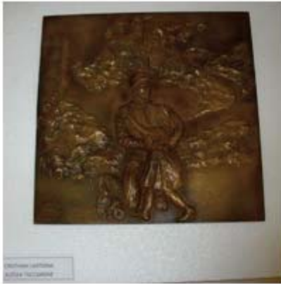
La Piastrina Bronzea

SANTI COSMA E DAMIANO – Sono in mostra presso il pian terreno del Comune di Santi Cosma e Damiano , presso il Laboratorio di Marketing Territoriale , le sculture in bronzo realizzate nell'ambito del progetto "Pellegrini della memoria" che ha coinvolto le comunità dei comuni di Santi Cosma e Damiano e Castelforte, i "Bronzi della Memoria" .